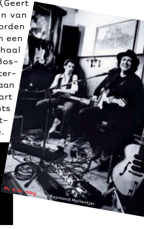
Mr. & Mr. Mörg

OP VRIJDAGMIDDAG 8 AUGUSTUS - TUSSEN 17.00 - 17.45 UUR - WORDT HET FESTIVAL MET EEN SPECIALE EDITIE VAN BOULEVARD SPECIALS IN HET ESSENTHEATER OP DE PARADE GEOPEND MET HET PARADEVERHAAL VAN NIEMAND MINDER DAN MINISTER PLASTERK. OOK KOMT IN HET OPENINGSPROGRAMMA BISSCHOP HURKMANS AAN HET WOORD.